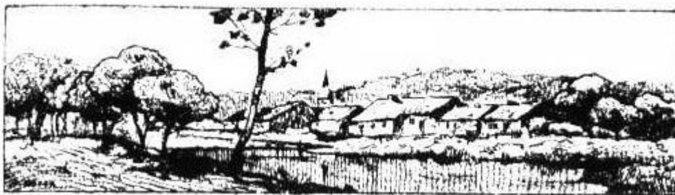
TABLE DES MATIERES (par Bernard Goorden) « La bataille de Jemappes – un monument »

https://www.idesetautres.be/upload/WALLONIA%201909%2017%20TABLE%20MATIERES%20LIENS%20INTERNET%20CONTENU.pdf